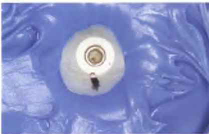
Abb. 20: Duplieren des individuellen Gingivaformers.