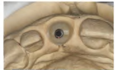
Abb. 22: Wachsmodellierung der Zirkonoxidhülse für das Keramik-Abutment.

Eine Woche nach der Abformung wird der Zahn extrahiert und eine erste provisorische Versorgung in Form einer Teilprothese mit Klammerverankerung eingegliedert ( Abb. 8 ). Das Pontic hat die Aufgabe, das Weichgewebe zu stabilisieren und auszuformen. Nach vier Wochen wurde die Teilprothese durch eine Klebebrücke ersetzt ( Abb. 9 und 10 ), die ebenfalls, nun bei reduzierter Pontictiefe, das Weichgewebe und die Papillen stützt.