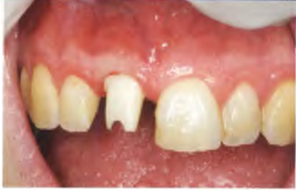
Abb. 23: Einprobe des Keramik-Abutments. Die distale Schulter wurde noch etwas tiefer gelegt.