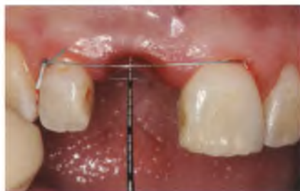
Abb. 12: Die Implantatschulter wird bukkal zwei bis drei Millimeter unterhalb des Weichgewebesausmaßes positioniert.