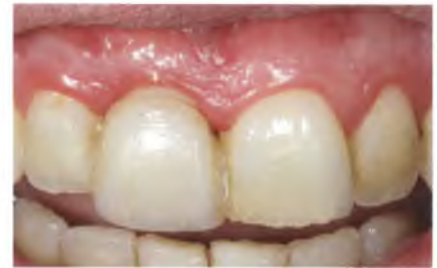
Abb. 19: Zwischen dem individuellen Gingivaformer und der Klebebrücke darf keine direkte Verbindung bestehen.