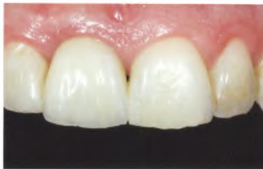
Abb. 26 und 27: Ein Vergleich der Ausgangssituation mit dem Behandlungsergebnis eine Woche nach dem Einsetzen.

Zirka sechs Wochen nach der Implantation wird eine Abformung genommen, um auf dem Modell einen individuellen Gingivaformer herstellen zu können (Abb. 15). Dieser soll das Weichgewebe in labialer Richtung noch besser unterstützen. Diesen Prozess vollziehen wir in zwei Schritten, wie aus Abbildung 16 ersichtlich ist. In einem ersten Schritt wird ein Gingivaformer hergestellt, der bis zur roten Linie extendiert ist (Abb. 17). Beim Einsetzen zeigt sich durch die temporäre Anämie, wie das Gewebe verdrängt wurde. Zwei Wochen später wird der Gingivaformer in einem zweiten Schritt noch weiter extendiert