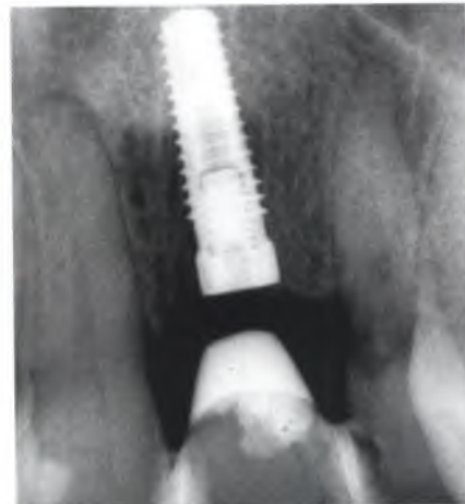
Abb. 32: Als therapeutisches Provisorium diente eine Klebebrücke, in welche die extrahierte natürliche Zahnkrone eingearbeitet wurde. Der Abstand des Ovate Pontic zur Implantatschulter beträgt zirka zwei Millimeter.