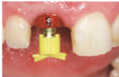
Abb. 21: Abformung mit individuellem Abformpfosten.