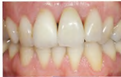
Abb. 37: Vollkeramikkrone in situ.