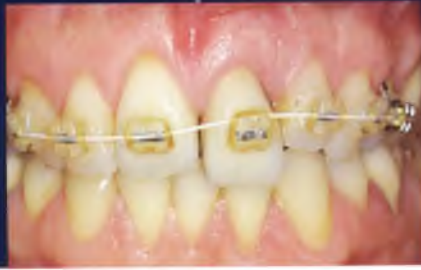
Abb. 29 Ergebnis nach abgeschlossener kieferorthopädischer Vorbehandlung.