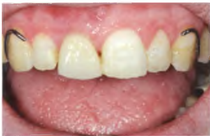
Abb. 8: Erste provisorische Versorgung in Form einer Teilprothese mit Klammerverankerung.