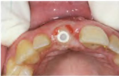
Abb. 17: Gingivaformer, der bis zur roten Linie extendiert wurde.