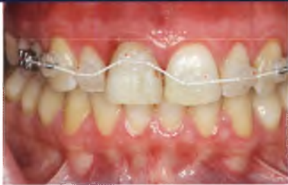
Abb. 5: Angelegte kieferorthopädische Apparatur für die Forced-Extrusion-Technik.