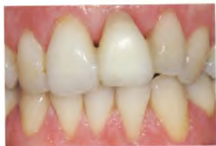
Abb. 31 (Mitte): Situation vor der Freilegung zirka sechs Monate nach der Zahnextraktion und vier Monate nach der Implantation.