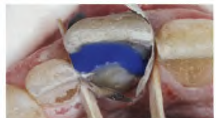
Abb. 4: Adhäsive Verklebung des tief längsfrakturierten Zahnes. Das Anlegen eines Kofferdams war in diesem Fall nicht möglich und auch nicht notwendig.

In der zweiten Sitzung wurde der Zahn so tief wie möglich adhäsiv verklebt und maximal stabilisiert, um ihn noch für die Forced-Extrusion-Technik heranziehen zu können ( Abb. 4 ). Dieses Potenzial wollten wir nicht ungenutzt lassen. Bei der adhäsiven Verklebung handelt es sich in diesem Fall um eine rein temporäre Maßnahme ohne Anspruch auf Langzeitstabilität.