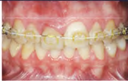
Abb. 6: Ergebnis nach Extrusion des Zahnes von zirka drei Millimetern.