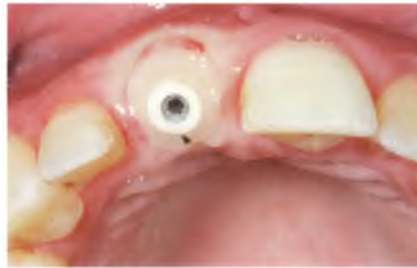
Abb. 18: Extension des Gingivaformers ähnlich dem Durchtrittsprofil eines natürlichen Zahns.