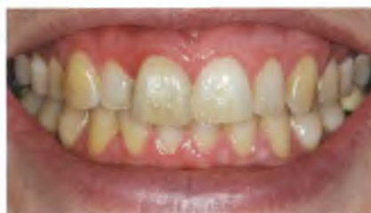
Abb. 3: Der „i“-Laut simuliert die Exposition der Gingiva bei normaler Lippendynamik und ist ein Indikator für den Schwierigkeitsgrad des jeweiligen Falles.

Die Patientin stellte sich mit einem elongierten und längsfrakturierten mittleren Schneidezahn in unserer Praxis vor ( Abb. 1 und 2 ). Der Zahn wurde in einer ersten Sitzung initial stabilisiert. Es erfolgte die Durchführung der „i“-Sprechprobe wie beschrieben, bei der sich wiederum die Gingiva bei normaler Lippendynamik maximal darstellt ( Abb. 3 ).