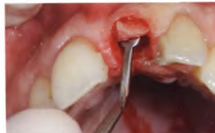
Abb. 33: Freilegung mit einem Mikrorollappen nach hufeisenförmiger Inzision.