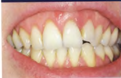
Abb. 28: Ein ästhetisch anspruchsvoller Fall: Die Patientin zeigt beim Aussprechen des „i“-Lautes in maximaler Interkuspitation sehr viel Gingiva.