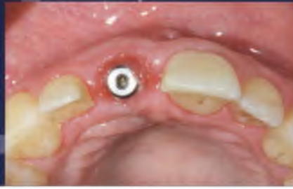
Abb. 15: Situation sechs Wochen nach Einbringen des Weichgewebetransplantats.