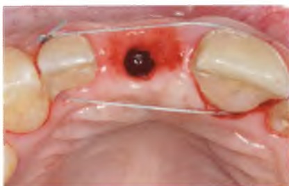
Abb. 11: Mit Hilfe der Technik von Dr. Claudio Cacaci (Schlinge mit Nahtmaterial um die Nachbarzähne) erfolgte eine adäquate bukko-orale Positionierung des Implantatstollens.