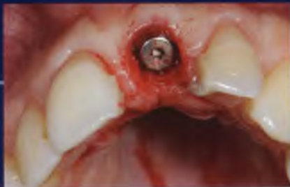
Abb. 34: Eingebachter Gingivaformer.