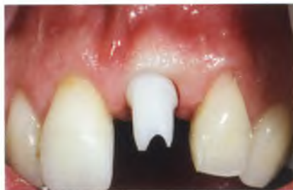
Abb. 36: Einprobe des individuellen Keramik-Abutments.