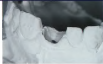
Abb. 7: Radierung eines Pontic von zirka drei Millimetern für die provisorische Versorgung.