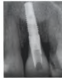
Abb. 38: Das Kontroll-Röntgenbild ein Jahr nach dem Einsetzen dokumentiert die gute knöcherne Integration.

Herstellung eines individuellen Keramik-Abutments ( Abb. 36 ) und einer Vollkeramikkrone ( Abb. 37 ).