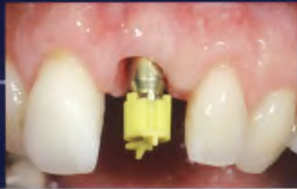
Abb. 35: Abformung für die definitive Versorgung.