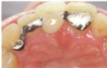
Abb. 9 und 10: Nach vier Wochen wurde die Teilprothese durch eine Klebebrücke ersetzt, die ebenfalls, nun bei reduzierter Pontictiefe, das Weichgewebe und die Papillen stützt.