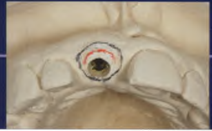
Abb. 16: Anzeichnungen für die Extension der Gingivaformer bis zur roten und bis zur schwarzen Linie.