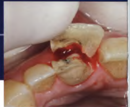
Abb. 1 und 2: Ausgangssituation: ein elongierter und frakturierter mittlerer Schneidezahn.