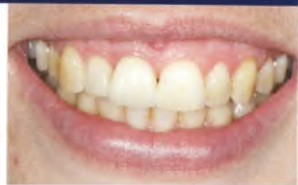
Abb. 24 und 25: Das ästhetische Ergebnis eine Woche nach dem Einsetzen der Vollkeramikkronen.