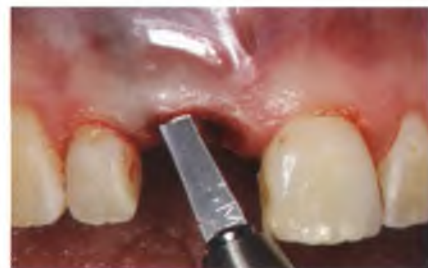
Abb. 13: Die Tasche für das Weichgewebetransplantat wird mithilfe eines Mikroskalpells unterminierend präpariert.

Ziel der Anwendung der forcierten kieferorthopädischen Extrusion in diesem Fall war es, vor der späteren Implantation bei ausreichendem Knochenangebot das Weichgewebe zu vermehren und damit im Endergebnis kein Weichgewebsdefizit, sondern eine stabile weichgewebige Situation herbeizuführen. Bei der forcierten Extrusion werden vertikale extrusive Kräfte eingesetzt, die den Zahn und den gingivalen Faserappa-