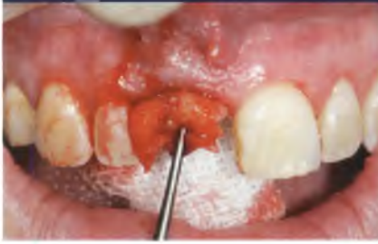
Abb. 14: Einbringen des Weichgewebetransplantats.